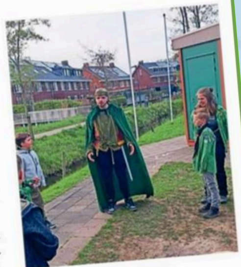
> Ridder in Schiedam.

Door het thema werd het programma iets aangepast. De kinderen waren onder de indruk van het verhaal en de verschijning van de ridder.